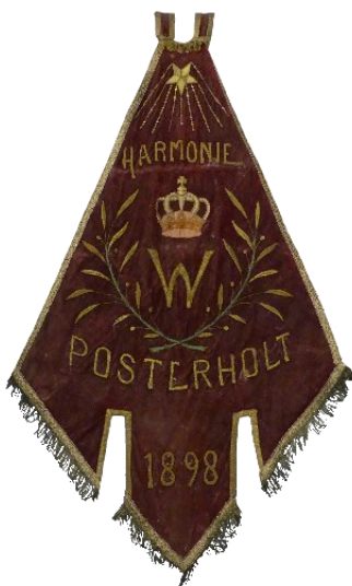
de tweede drapeau

Begin jaren vijftig van de vorige eeuw kreeg de harmonie de tweede drapeau . Deze kreeg weer een gekroonde W, zonder guirlandes, maar met lauriertakken.