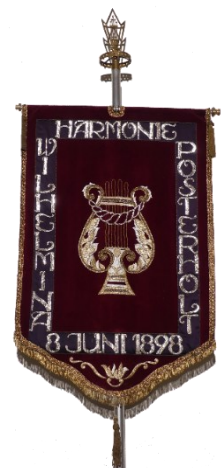
de derde drapeau

Harmonie Wilhelmina besloot in 1998 om naar de oude vorm terug te keren. Let op de datering. In het archief werd de juiste datum gevonden.