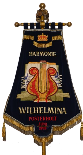
de vierde drapeau

De vierde drapeau – ontworpen door Martien Heffer uit Liempde en gerealiseerd door Anny Swinkels uit Boxtel – werd op 2 januari 1999 tijdens de afsluitende viering van het 100-jarig bestaan aan de harmonie aangeboden. 'Het centrale gedeelte van het vaandel bestaat uit een compositie van beeldelementen die in relatie staan tot muziek en landschap. Dominant is de decoratieve verwerking van de lier, een instrument dat al eeuwen als algemeen symbool voor muziekuitingen is gebruikt, in een moderne uitvoering. Het instrument is goed centraal toe te passen en heeft veel mogelijkheden in zich om daar decoratief iets mee te doen. Op dezelfde wijze zijn bladmuziek en notenbalken uitgewerkt, waarbij het niet in de eerste plaats om de realiteit gaat, maar de versierende waarden worden uitgebuit. Glooiende vlakken symboliseren iets van het heuvelachtige Limburgse landschap en kunnen associaties oproepen met ritmes in de muziek. Vanuit dezelfde uitgangspunten zijn begeleidende vlakken in de achtergrond gerangschikt. De kroon symboliseert vooral een keurmerk van kwaliteit.' Aldus Martien Heffer.